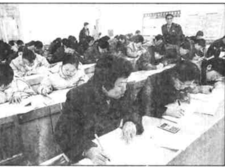
垦利县地税局高盖分局近日对辖区的企业进行分类管理及纳税申报进行资格考试，从而大大提高了企业办税员的税法知识及自觉纳税意识，为保证今后税收工作的开展奠定了良好的基础。

正农公司波尔山羊胚胎移植创新纪录 本报讯 近日，由内蒙古畜牧科学院胚胎移植中心，为我市正农公司养殖示范场进行波尔山羊胚胎移植，在对19只波尔山羊供体母羊的采胚中，共采可用胚胎318枚，平均可用胚16.7枚，是一只供体母羊采出的最高胚胎枚数，移植双胎率属国内罕见。(郑建祥 张永志)